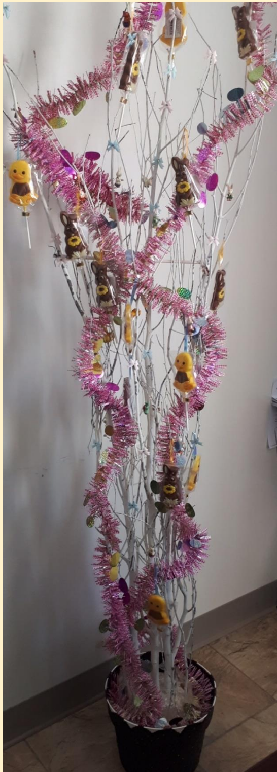
Arbre de Pâque